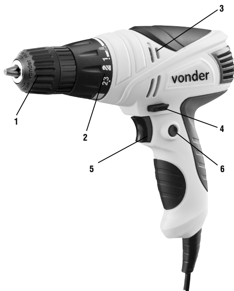
Fig. 1 – Componentes